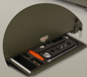
Gaveta de ferramentas e peças de reposição. Tools and spare parts tray.