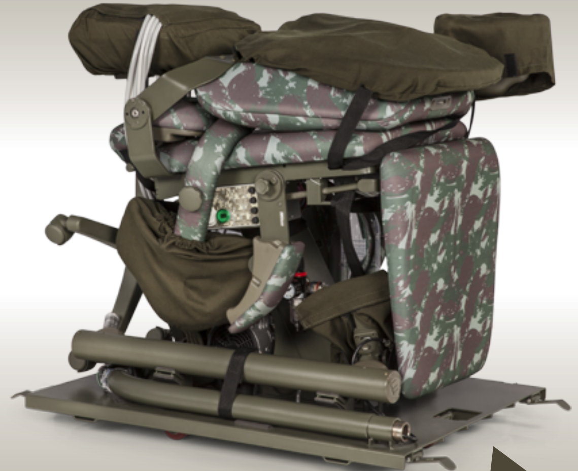
Rodas de poliuretano escamoteáveis, para o deslocamento em superfícies regulares. Swivel polyurethane wheels for displacement on regular surfaces.